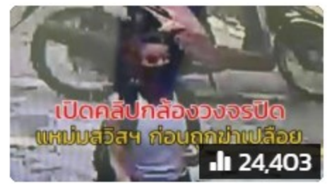
เปิดคลิปกล้องวงจรปิดจับภาพ แหม่มสวิสา ก่อเหตุฆ่าเปลือย 24,403