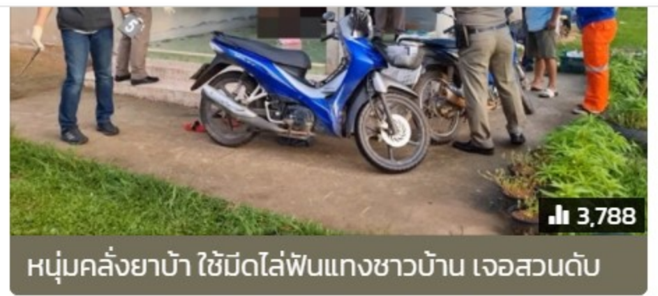
หมู่บ้าน ไซมิดไล่พันแทงชาวบ้าน เจอสวนดับ 3,788

สุราษฎร์ธานี - สมเด็จพระเจ้าลูกเธอ เจ้าฟ้าจุฬาภรณวลัยลักษณ์ อัครราชกุมารี โปรดเกล้าโปรดกระหม่อมให้ราชวิทยาลัยจุฬารณย์ เชิญถุงยังชีพพระราชทาน และยาพระราชทาน จำนวน 445 ชุด แก่ผู้ว่าราชการจังหวัดสุราษฎร์ธานี เพื่อมอบให้แก่ผู้ประสบอุทกภัยในพื้นที่จังหวัดสุราษฎร์ธานี