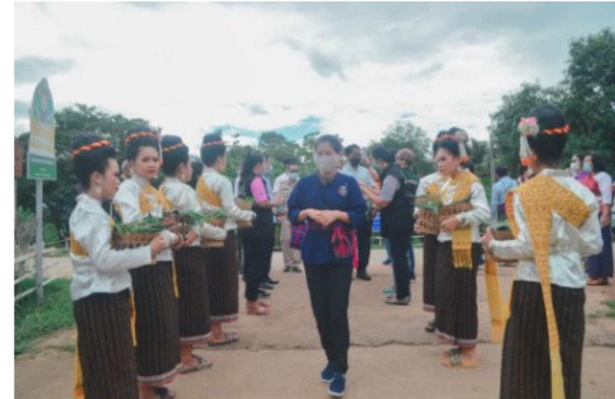
จ.เพชรบูรณ์ พอเพียง คัดสรรกิจกรรมพัฒนาชุมชนดีเด่น