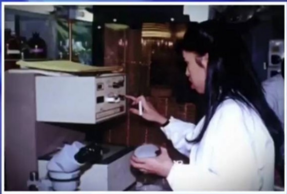
and toxicology, Her Royal Highness had established the Chulabhorn Research