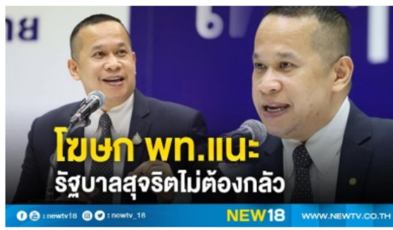
โฆษก พท.แนะรัฐบาลสุจริตไม่ต้องกลัว