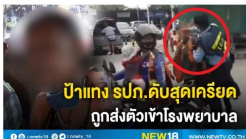
ป้าแกง รปภ.ดับสุดเครียด ถูกส่งตัวเข้าโรงพยาบาล