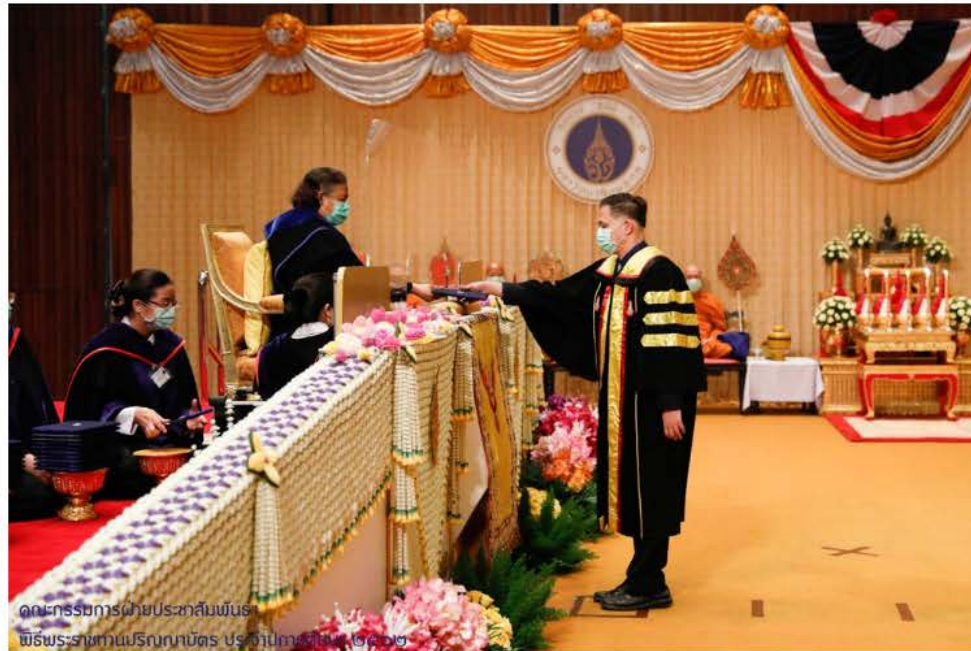
คณะกรรมการฝ่ายประชาสัมพันธ์ พิธีพระราชทานปริญญาบัตร ประจำปีการศึกษา ๒๕๖๒